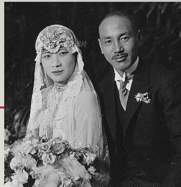
Сун-Мэйлин и Чан Кайши