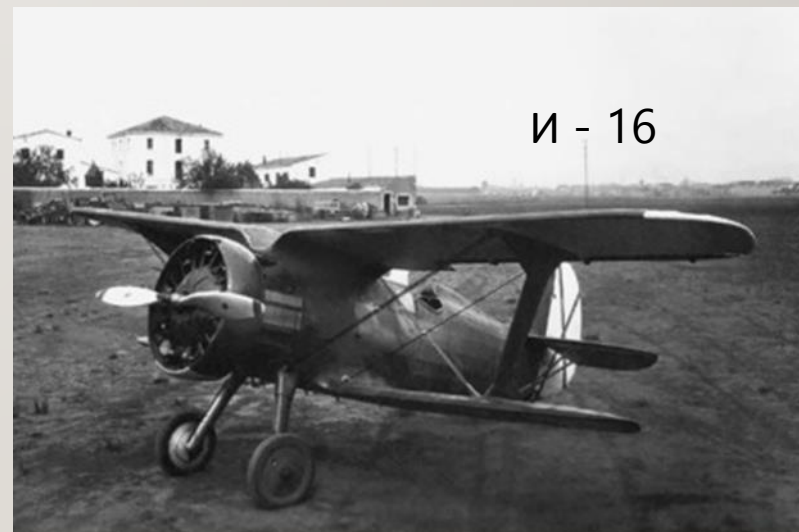
И - 16