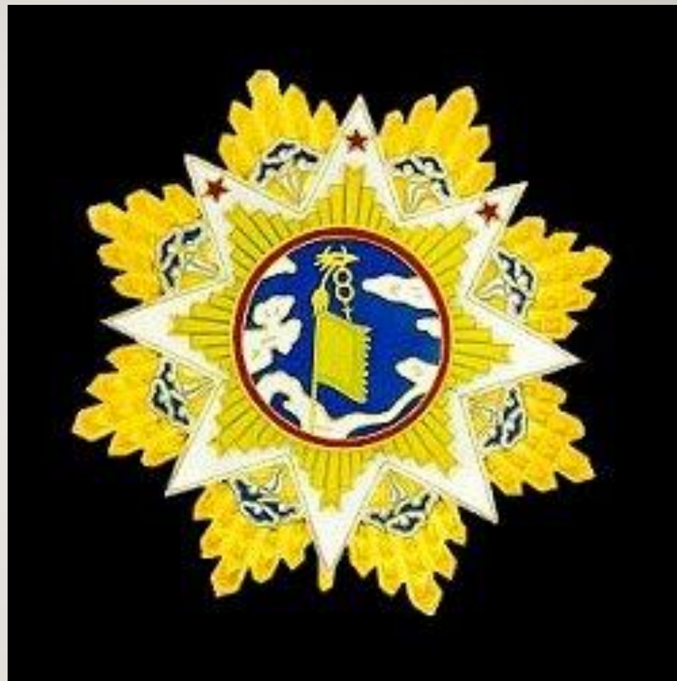
Орден Облаков и Знамя (точное название — Орден Заоблачной Хоругви (награда Чан Кайшистского Китая)