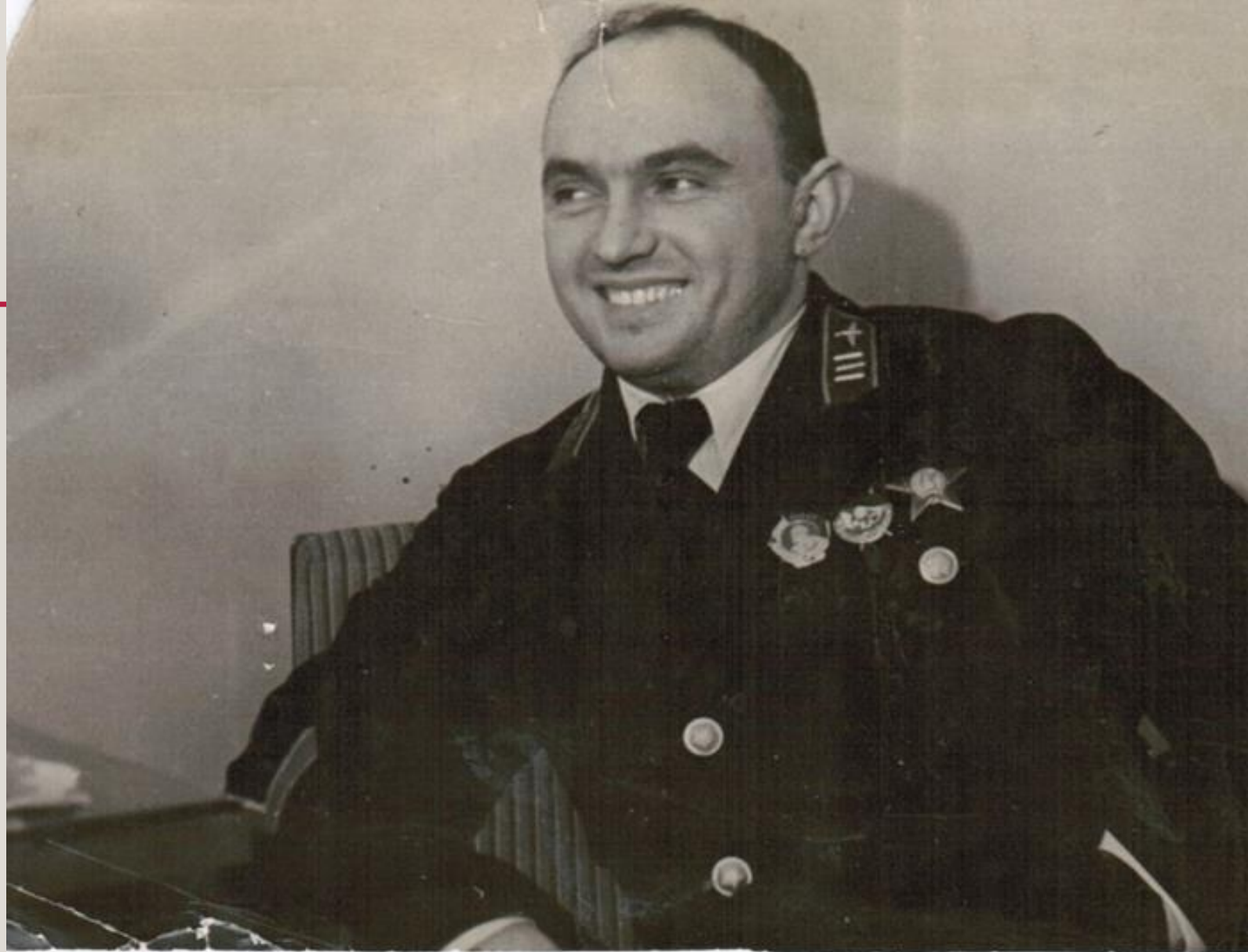
После возвращения из Китая, 1938 год